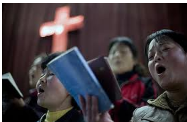
Kinijos krikščionys meldžiasi

Kinijos Religinių reikalų nuostatų 9 str. nustato sąlygas, pagal kurias valstybės patvirtintos religinės grupės gali steigti ir išlaikyti religines švietimo institucijas. Šios sąlygos aptaria ugdymo turinio planus, taisykles studentams, dėstytojams ir administratoriams, reguliuoja finansinių resursų ir įrangos klausimus. Minėtų nuostatų 10 str. penkioms valstybės patvirtintoms religijoms leidžia priimti studentus iš užsienio.