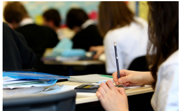
Religinis švietimas: tik konfesinis?

Interviu akcentuojama objektyvių žinių svarba siekiant supažindinti visuomenę su įvairiomis religijomis bei sumažinti neigiamas nuostatas jų atžvilgiu.