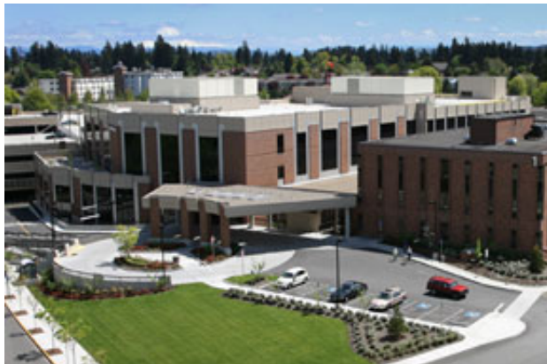
Adventistų ligoninė Portlande, JAV